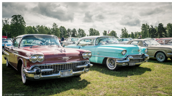
Sola Spring Meet, Norra Fältet