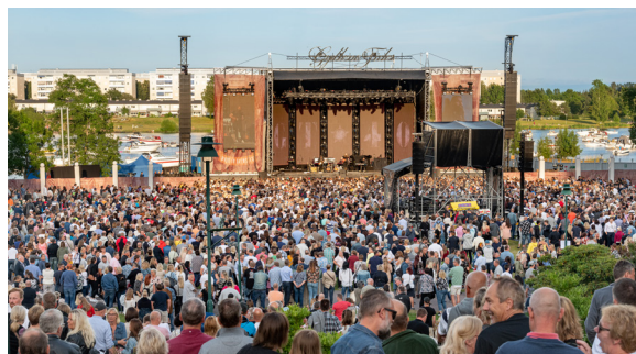
Konsert på stora gräsytan, Mariebergsskogen