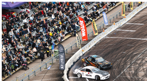
Karlstad Sun City Drift, parkeringsytan vid Löfbergs Arena