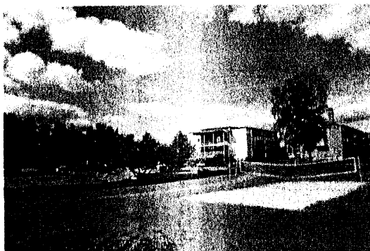
Bild på Sjösalaparken

- Att Karlstad kommun anlägger en besökstolett vid Sjösalaparken.