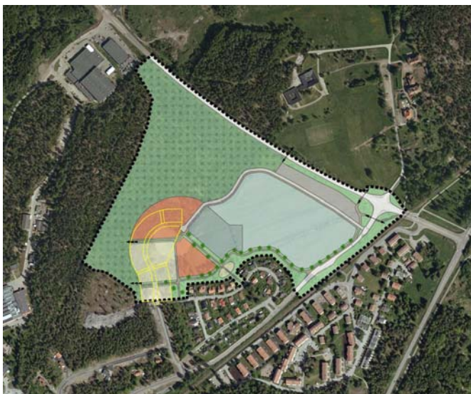
Gul markering: Planlagd mark för bostäder (småhus) i gällande detaljplan.

Delar av området är i gällande detaljplan från 2007 planlagt för bostäder (småhus) men denna rätt har inte utnyttjats bla pga av att vatten och avlopp måste anslutas mot norr och inte mot befintliga Storkullsgatan. För att skapa möjlighet för Bovieran att uppföra flerbostadshus förslås byggrätten ändras till en större sammanhängande byggrätt. Mot Storkullsgatan bibehålls två småhustomter.