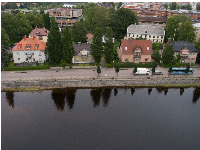
Flygvy över kvarteret Udden. Foto: Torben Tildeberg 2008.