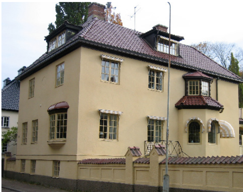
Sandgrundsgatan 3. Uppfört 1918 efter ritningar av arkitekt Knut Jonsson.

trädgårdssidan. Fönstren förekommer i en till tre lufter och kompletteras av burspråk både på nedre och övre våningen. Fönstren är spröjsade och några har blyinfattade färgade glas. Mot söder finns en stor inbyggd veranda med valv mot trädgården.