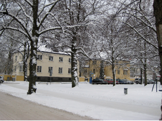
Sandgrundsgatan, kvarteret Udden 5, 6 och 7