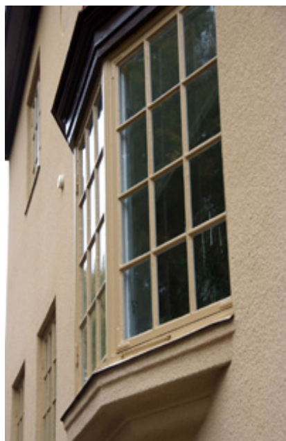
Detaljer i nationalromantisk stil på Sandgrundsgatan 3. Foto: Cecilia Hellekant 2008.