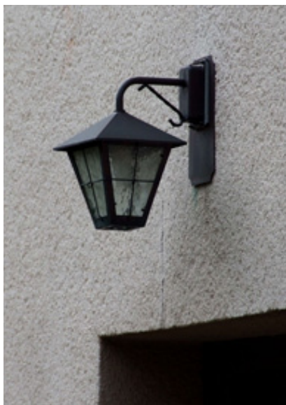
Detaljer från bostadshuset vid Sandgrundsgatan 5.