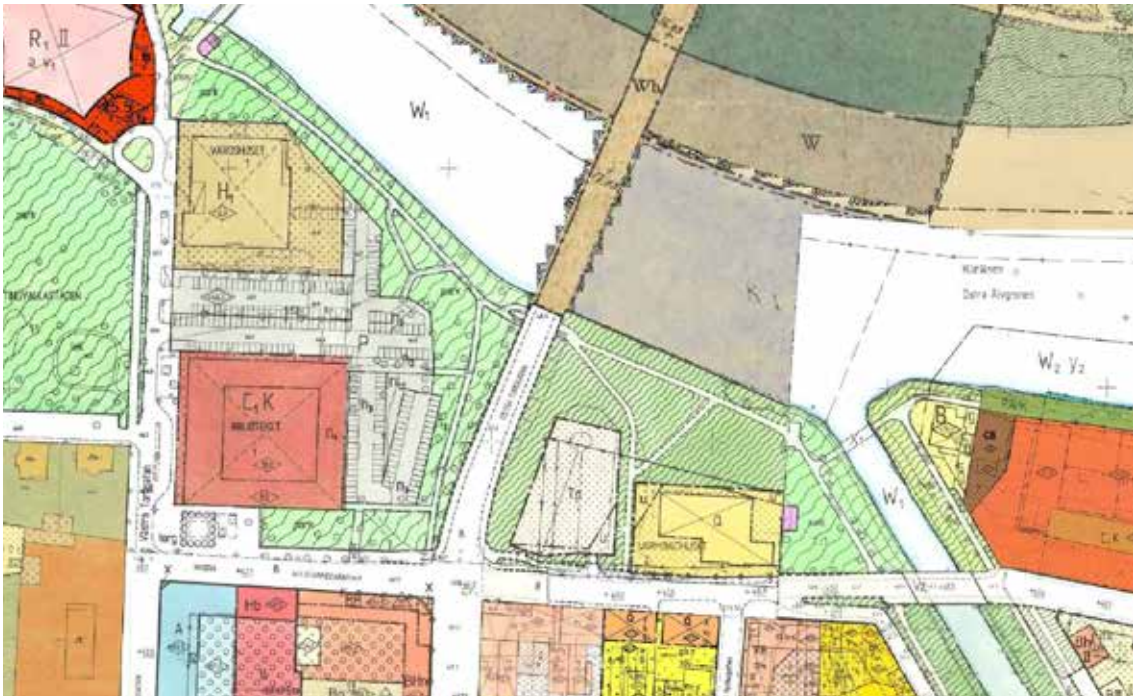
Utdrag ur gällande detaljplaner.